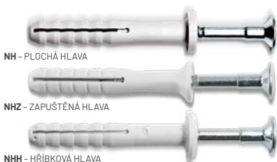
NH - PLOCHÁ HLAVA